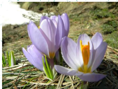
Lulebora e Pelisterit ( Crocus pelistericus )

Vendbanimet shkëmbore janë të shpeshta dhe karakteristike për PN Pelister. Te ky tip përfshihen të gjithë siparet silikate në rrafshnaltat e Evropës së Mesme.