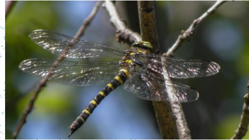
Pilivesa ( Cordulegaster heros )