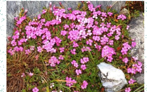
Karafili i shtrirë ( Dianthus myrtinervius )