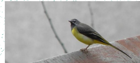
Bishtatundësi i përhimë ( Motacilla cinerea )