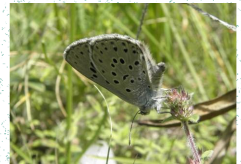
Flutura e kaltër pastruese ( Maculinea arion )