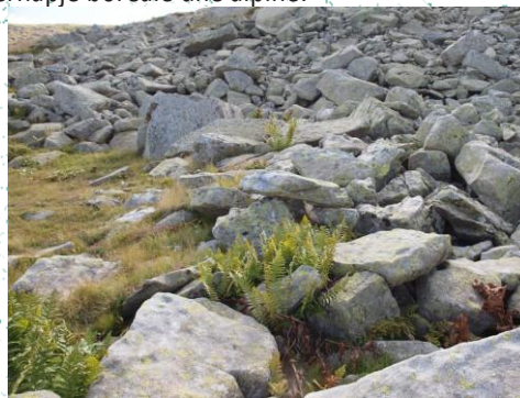
Lugina e Lumit Magarev

“Lumejtë guror” të njohur në PN Pelister i përkasin këtij tipi të vendbanimit. Siparet silikate janë shumë të rëndësishme sidomos për likenë dhe myshk, si dhe për fieret, të cilat përfshijnë lloje të rralla me përhapje boreale dhe alpine.