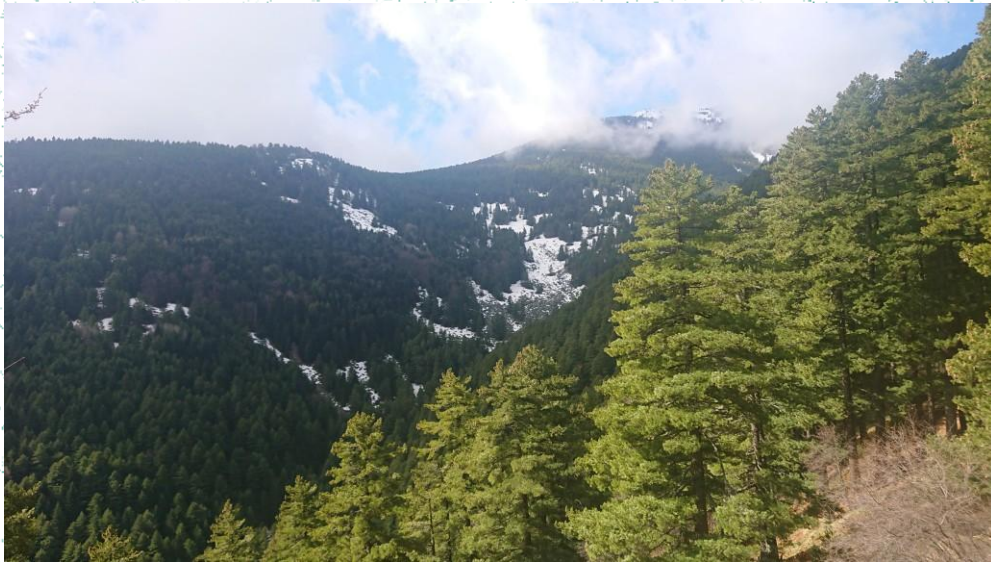
Pylli me molikë – pamje nga lokaliteti Guri i Dallëndyshes.

Molika paraqet një nga fenomenet më të rëndësishme dhe më interesante biogeografike, ekologjike dhe vegjetative në Gadishullin Ballkanik.