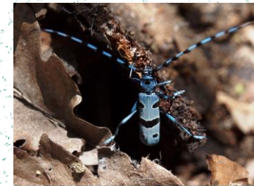
Antenagjati ( Rosalia alpina )