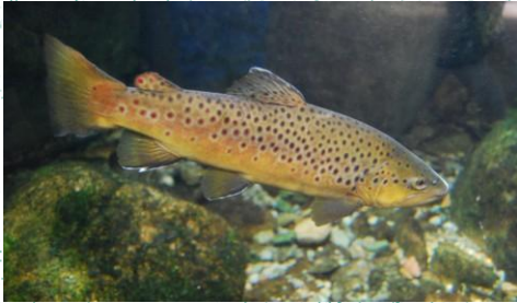
Trofta e Pelisterit ( Salmo peristericus )