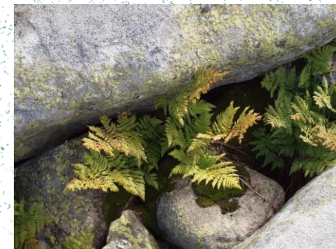
Fieri alpin- Dryopteris expansa