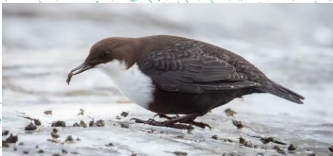
Mëllenja e ujit ( Cinclus cinclus )