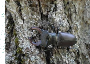
Acadreni ( Lucanus cervus )