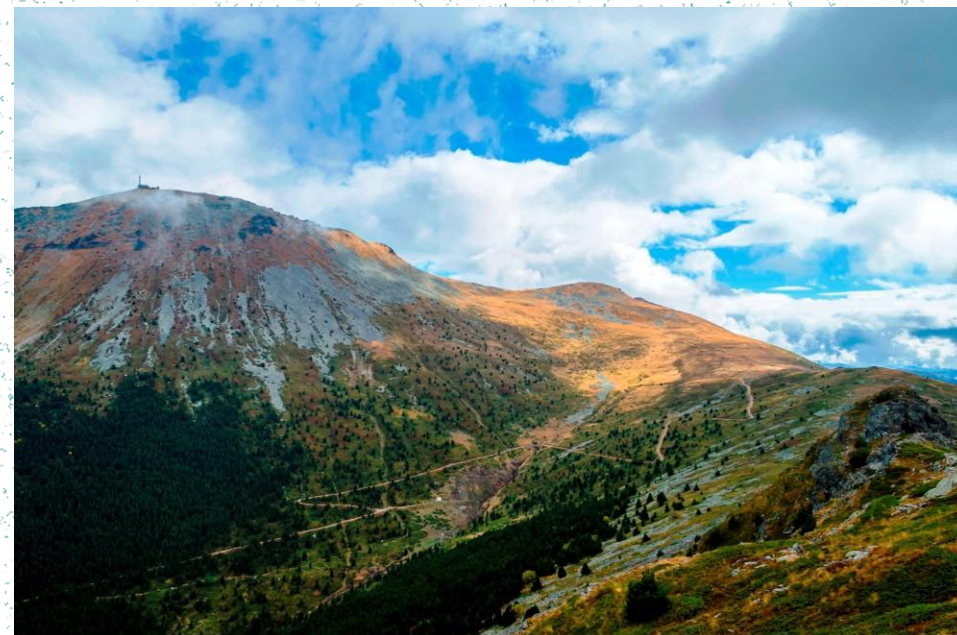
Sipërfaqet acidofile oromezike me bar (62D0)

Si rezultat i përbërjes gjeologjike, terrenit specifik dhe klimës malore në park janë formuar lloje të ndryshme të vendbanimeve të cilat shquhen me biodiversitet të begatshëm dhe të rëndësishëm. Më të shprehura dhe më të rëndësishme janë pyjet me arneni (Pinus peuce) – molika. Parku Nacional Pelister është fole e nëntë llojeve endemike dhe i një numëri të madh të luleve dhe llojeve të rrezikuara.